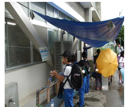
雨の日もしっかり手洗い