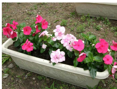
プランターのニチニチソウ